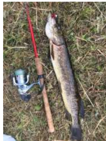
Трофей Антона Михайловича на рыбалке в Рио-Де-Жанейро ☺Интервью

Сила в правде. Правда – это сильнее, чем знания. Правда – это стремление к истине.